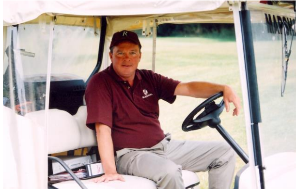
Gastvrouw / gastheer